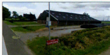
streetview Veenhuizerweg 10 Dalen